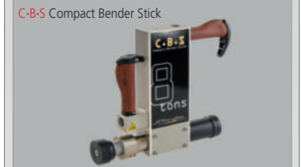
Positionieren - Richten - Biegen