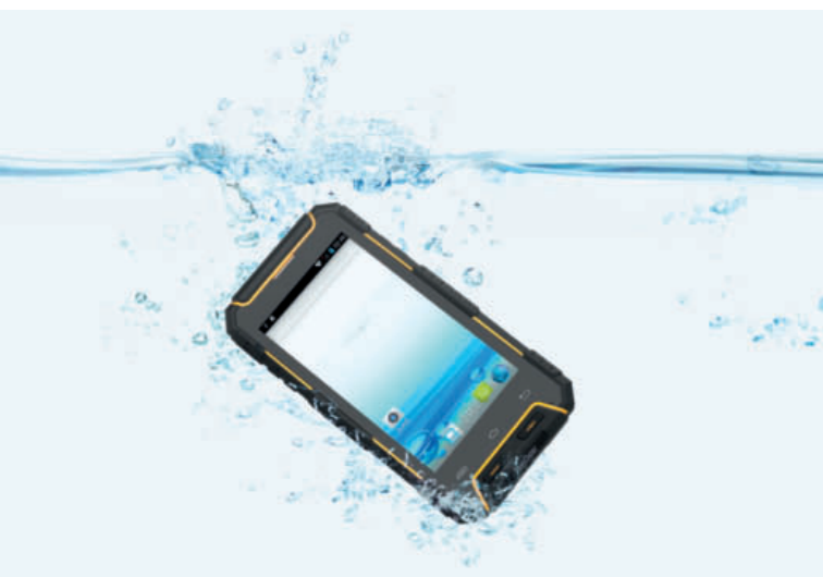
Im Betrieb Wickli in Neuhausen nutzen die 20 Mitarbeiter schon seit einigen Jahren Tablets und Smartphones. Wie mobile Geräte für den Baustellenbetrieb ausgestattet sein sollten – mehr darüber auf Seite 66