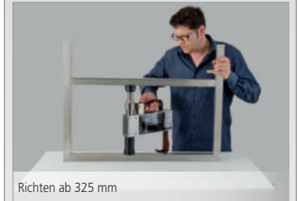
Richten ab 325 mm