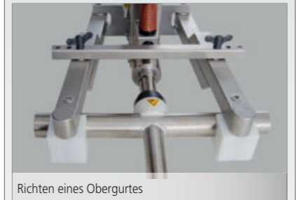
Richten eines Obergurtes