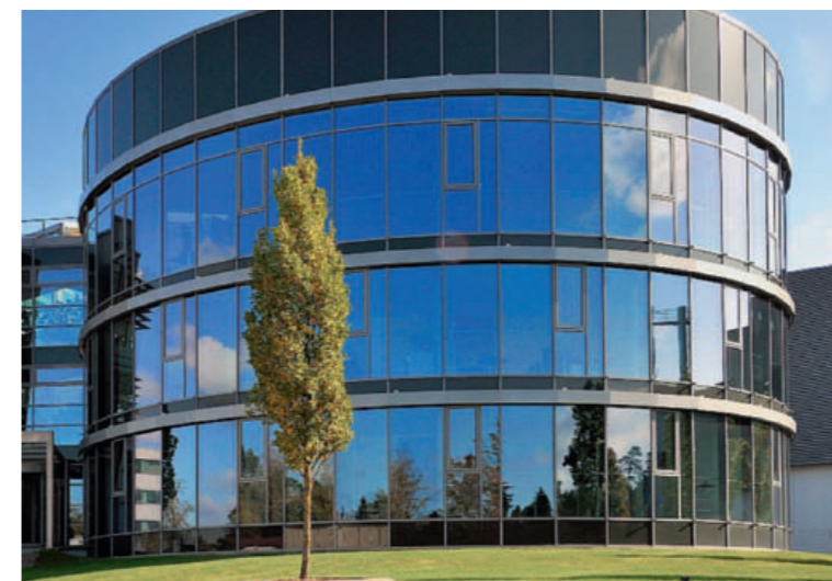
Bei der Fertigung und Montage von passivhaustauglichen Profilen, wie sie für das Firmengebäude von Hans Kupfer & Sohn in Heilsbronn eingesetzt wurden, gilt es für optimale Werte beim Blower Door Test auf Details zu achten. Ein Beitrag dazu auf Seite 22