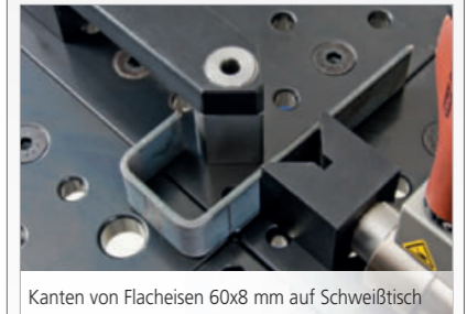
Kanten von Flacheisen 60x8 mm auf Schweißbisch

Gelber-Bieger GmbH Herkeswald 73 66679 Losheim am See Tel.: 0 68 72 / 50 500 60 Fax: 0 68 72 / 50 500 70 E-Mail: info@gelber-bieger.com www.gelber-bieger.com