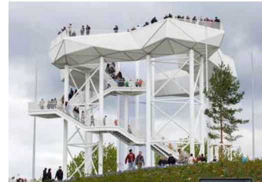
Das ausführende Unternehmen Vollack Hallen- und Stahlbau hat die Aussichtsplattform Wolkenhain in Berlin in BIM-Arbeitsweise umgesetzt. Über den Projektablauf mit Einsatz von Tekla Structures berichten wir auf Seite 20