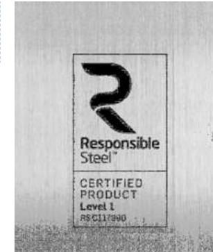
ResponsibleSteel ist eine Non-Profit-Organisation, die ein Label für Stahlprodukte und -werke erarbeitet. Das Zertifikatprogramm soll 2020 starten, ArcelorMittal möchte im Zuge von Pilotprojekten erste Unternehmen des Konzerns bis Ende 2019 zertifizieren. Seite 44