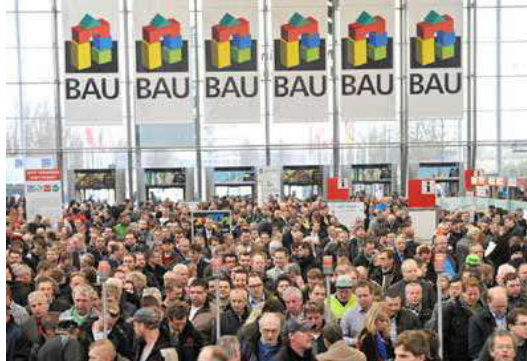
Die BAU mit rund 250.000 Besuchern ist eine große Messe. Mit den neuen Hallen C5 und C6 kann sich die Bauwirtschaft nun in 19 Hallen präsentieren. Treffpunkt für das Bauhandwerk ist in Halle C6. Seite 24