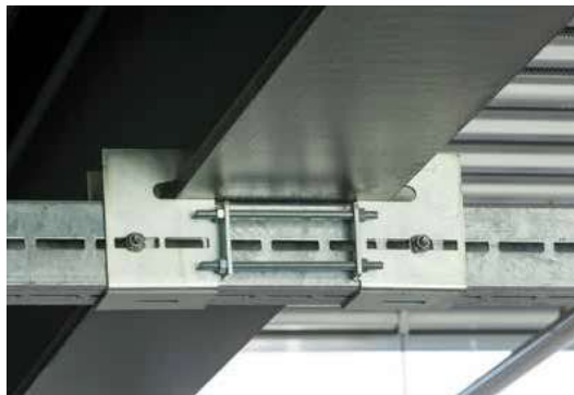
Lassen sich Rohrleitungen in Hallen nicht mit Dübeln befestigen, sind Klemmbefestigungen in Verbindung mit Montageschienen eine Alternative. Wir berichten über unterschiedliche Varianten. Seite 14