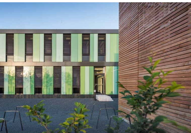
Der Bau der Molekularen Pflanzenwissenschaften an der Leibniz Universität Hannover wurde mit geschosshohen Gläsern verkleidet. Über die Verarbeitung des Systems Airtac Glass berichten wir auf Seite 67