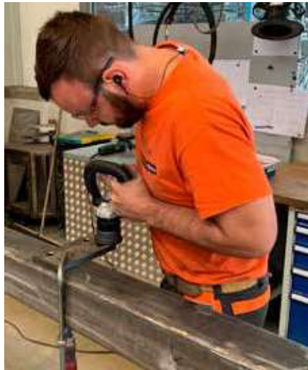
Titelbild: Beschläge für RC4 und RC5 Türen aus der Manufaktur

Metabo hat die Akku-Kantenfräse KFM 18 LTX 3 RF entwickelt, damit Metallbauer gleichmäßige, saubere Fasen und Radien nach DIN EN 1090-2 schleifen können. Vier Betriebe haben das Gerät getestet, die Auswertung lesen Sie auf Seite 51