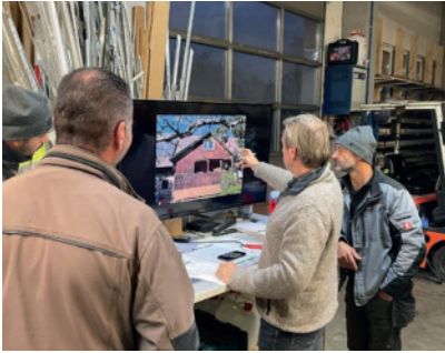
Als der Junior in die Firma Vordermayer in Neuenburg eingestiegen ist, hat er die Digitalisierung forciert. Mit Implementierung der Branchensoftware Vito ist der Metallbauer digital durchgestartet. Seite 28