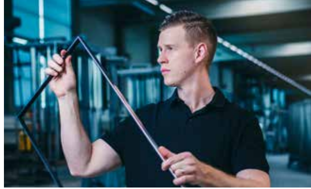
Das Hohlprofil des Ultimate Pro ist leichter zu verarbeiten.

Die Handhabung des Ultimate Pro innerhalb des Produktionsprozesses wird sicherer: Das bedeutet bessere Taktzeiten und minimierten Ausschuss im Produktionsprozess. Die optimierten Eckwinkel und Längsverbinder unterstützen die besondere Stabilität der Rahmen zusätzlich. Die vergrößerte Folienoberfläche