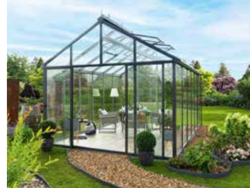
Ein Wohngewächshaus für den Garten.

Das Wohngewächshaus „Livingten“ wurde als Baukastensystem konstruiert. Die Aluminiumprofile enthalten spezielle Rillen (Führungsnuten), in denen die Bauteile des 15 qm großen Glashauses passgenau eingeschoben werden können. Dank dieser Steckverbindungen ist ein Bohren, Schrauben oder Kleben nicht notwendig. Hinzu kommt, dass alle Teile möglichst identisch konzipiert sind, sodass es beim Aufbau zu keiner Verwechslung der Materialien kommen kann. Die verwendeten Aluminiumprofile sind zweifarbig – innen silber und außen dunkelgrau. Die Zweifarbigkeit vereinfacht jedoch nicht nur die Montage, sie hat auch einen weiteren Grund: Die Elemente bestehen aus zwei Profilschalen, die in der Herstellung durch isolierende Kunststoffschalen verbunden werden. Das sorgt für eine thermische Trennung und damit eine hervorragende Isolierung innerhalb und außerhalb des Gewächshauses. Das „Livingten“ lässt sich daher wie ein Wintergarten nutzen und kann eine angenehme Innentemperatur vorweisen. Gummiabdichtungen und das 22 mm starke ISO-Sicherheitsglas kommen der Wohlfühltemperatur obendrein zugute.